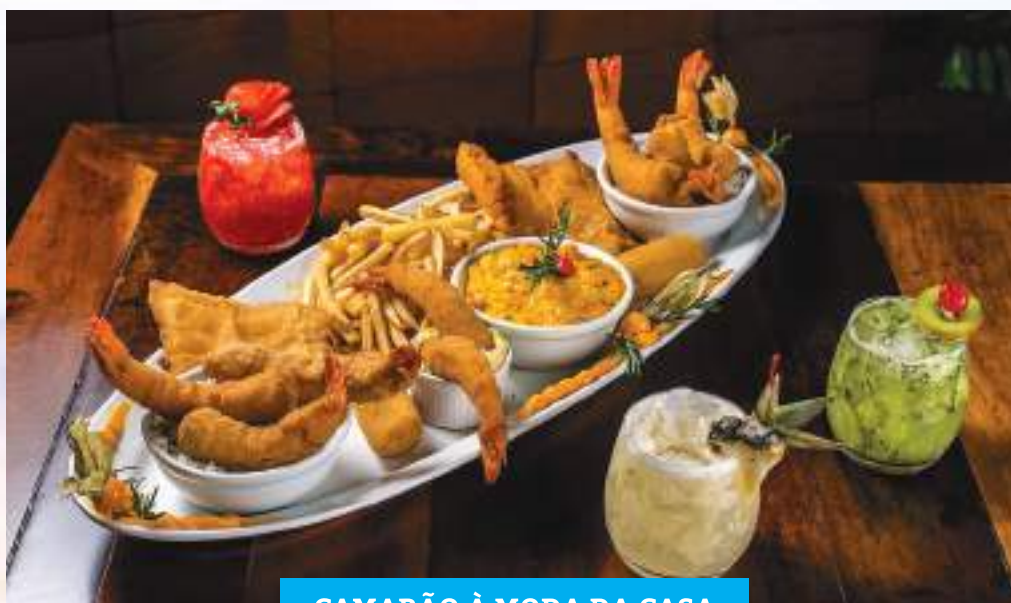
CAMARÃO À MODA DA CASA