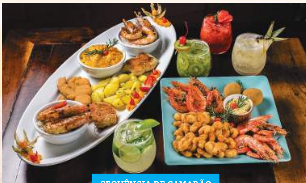
SEQUÊNCIA DE CAMARÃO