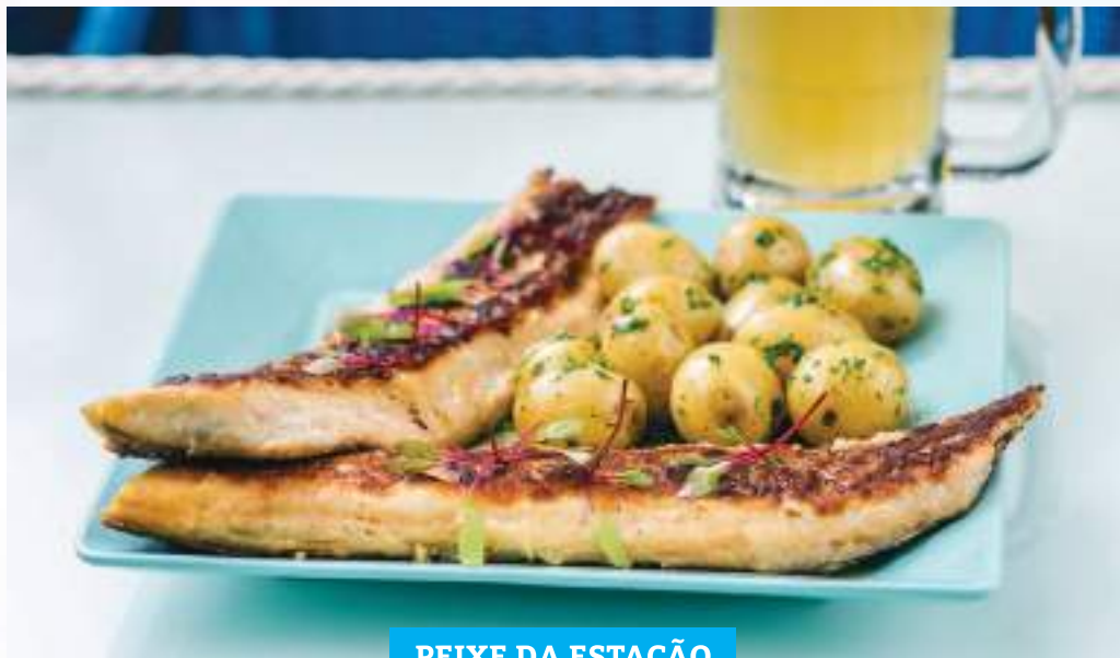
PEIXE DA ESTAÇÃO