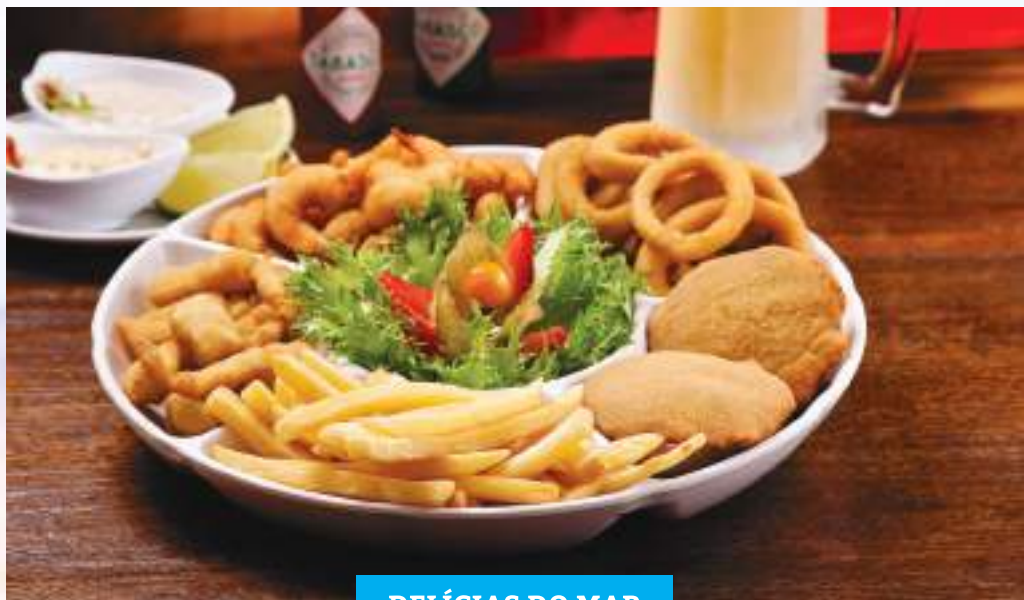
DELÍCIAS DO MAR