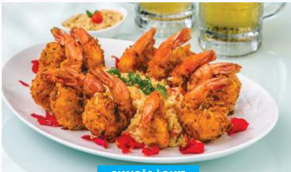
CAMARÃO À PANE