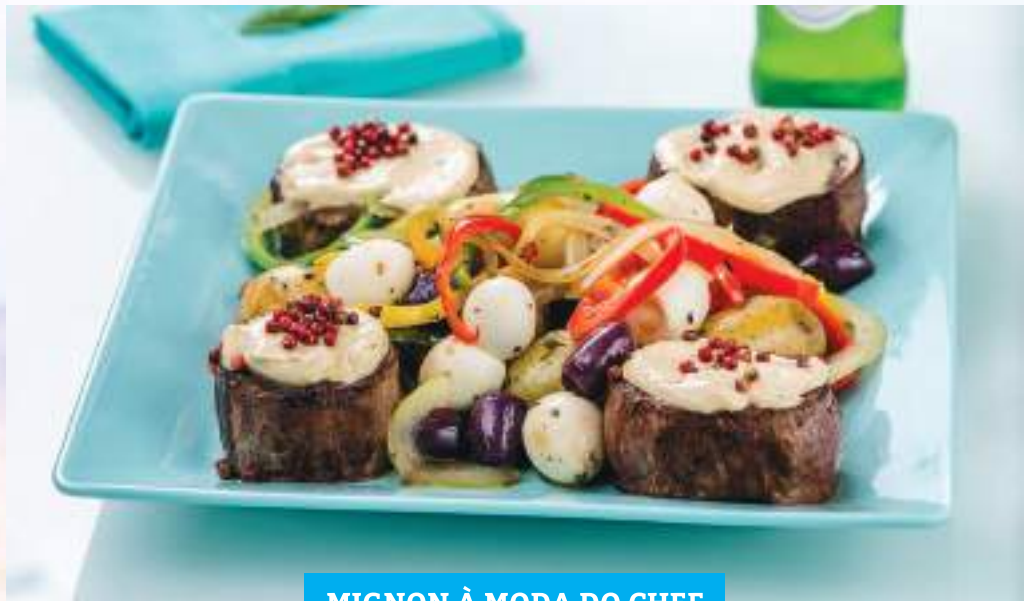
MIGNON À MODA DO CHEF