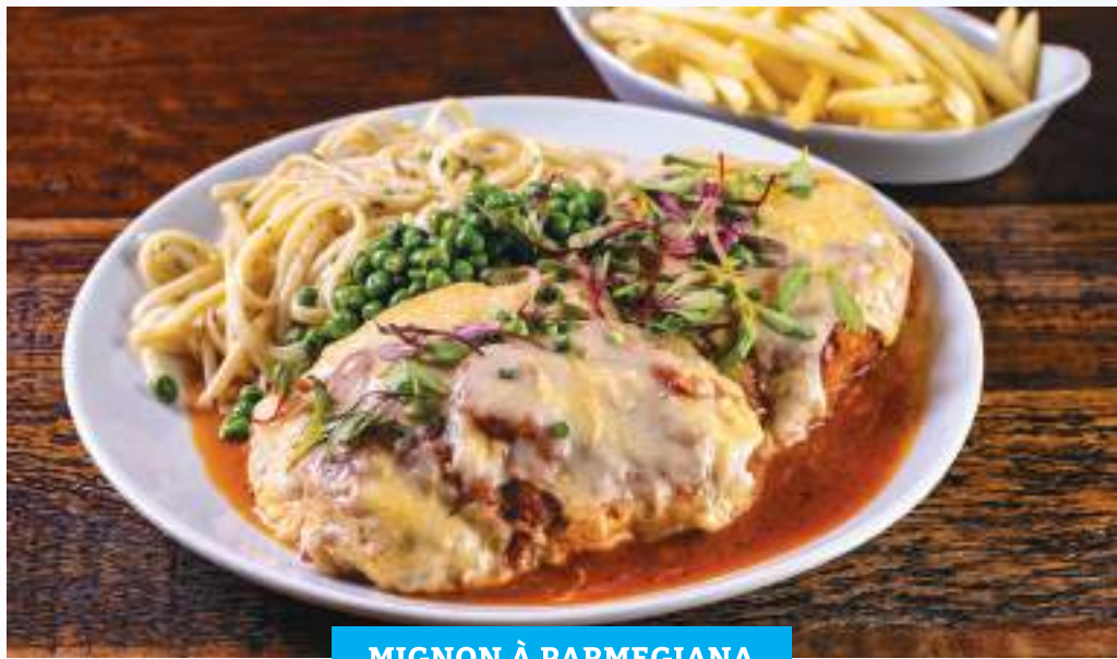
MIGNON À PARMEGIANA