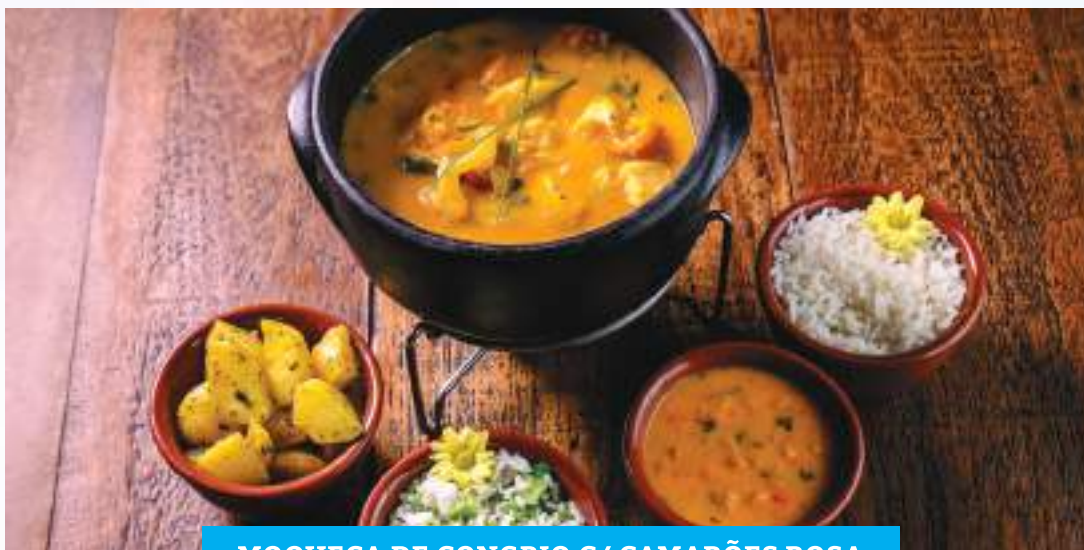
MOQUECA DE CONGRIO C/ CAMARÕES ROSA